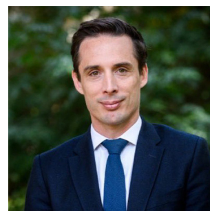
Jean-Baptiste Djebbari Ministre délégué chargé des transports

Tout ce qui permet d'encourager la mobilité des Français est une chance. Les véhicules en free-floating ne font pas exception. A nous de nous en emparer. A nous d'agir, ensemble, pour que le plus grand nombre puisse en bénéficier.