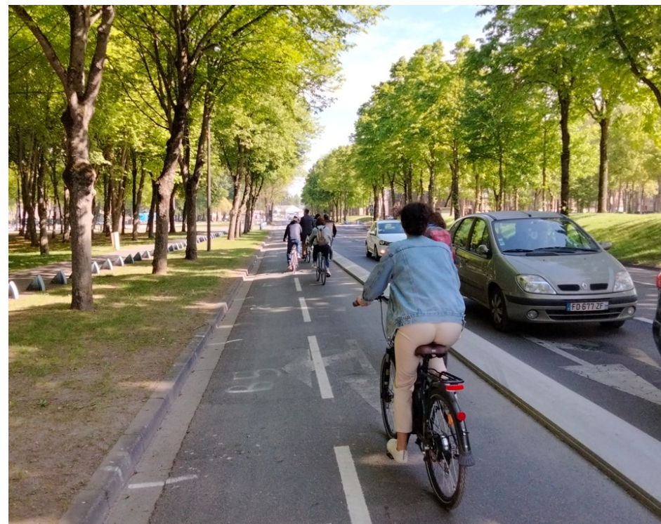
Visite à vélo le 2ème jour de formation - Amiens

Des formations dispensées par le CEREMA, avec les lauréats, pour leur permettre d'acquérir rapidement une « culture vélo » et de monter en compétence progressivement