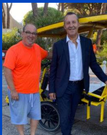
Stéphan Rossignol Maire de la grande motte et président de la communauté de communes du pays de l'or