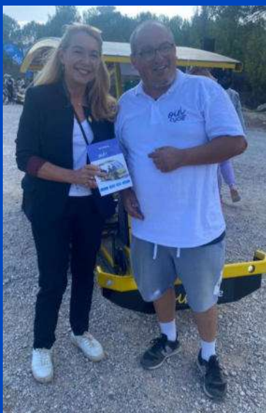
Laurence Cristol députée de la 3 e circonscription de l'Hérault