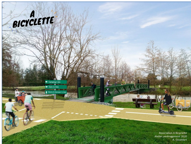
Ville d'Alençon – Passerelle sur la Sarthe