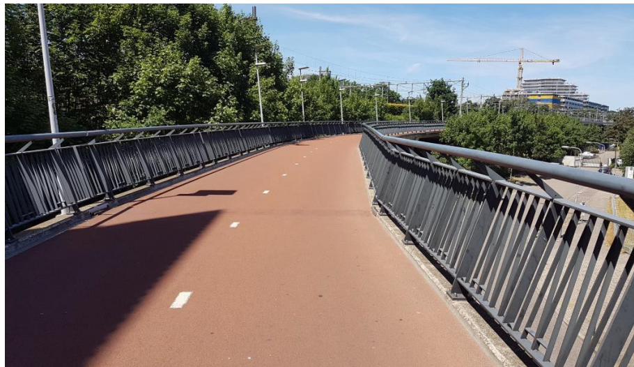
Ouvrage d'art avec garde-corps